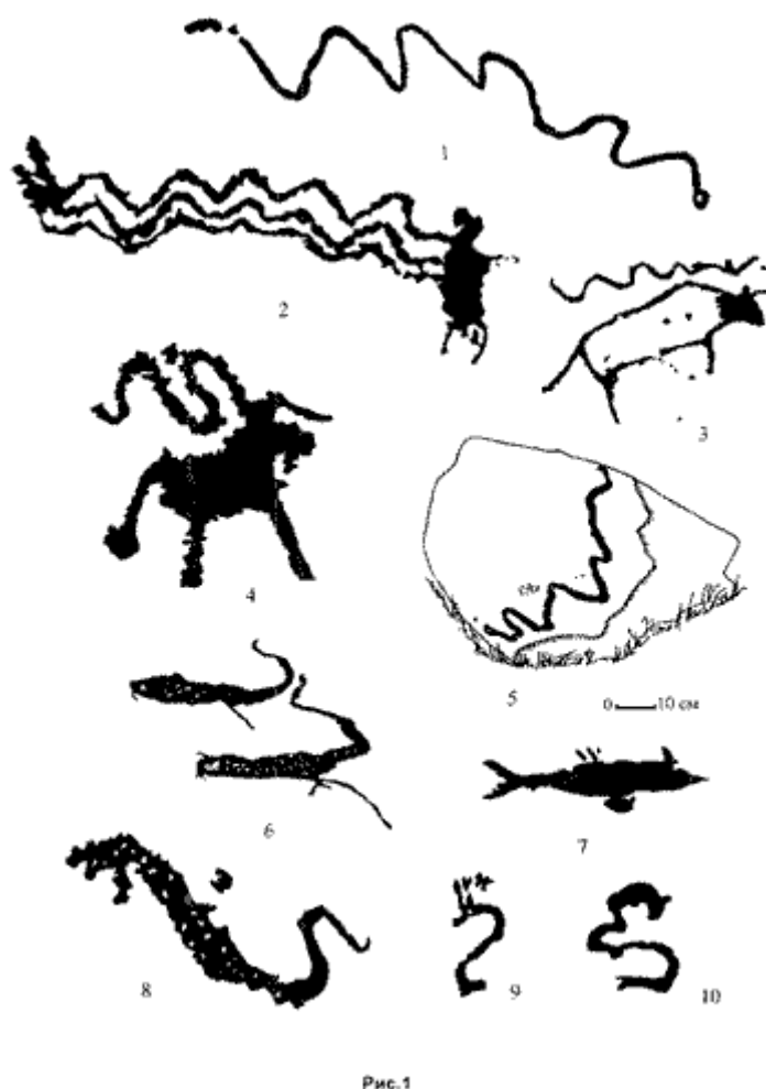
Рис. 1. Петроглифы комплекса Цагаан-Салаа — Бага-Ойгур (Монгольский Алтай).

На другом рисунке из Бага-Ойгура огромная змея, обвивая каменную глыбу (возможно, по форме ассоциируемую с мифической Мировой Горой), как бы заползает под неё (рис. 1 — 5), тем самым символизируя принадлежность рептилии к подземному миру и хтоническим существам. Именно такую отрицательную роль играют змеи (воплощение нижнего, водного подземного или потустороннего мира) в трёхчленной модели мира индоевропейской и индоиранской космогонических мифологий.